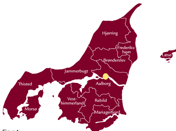
Figur 1: UCN's dækningsområde - Region Nordjylland ( Nordjyske kommuner )

Målgruppen for udbuddet er borgere bosiddende i hele regionen. Udbuddet placeres fysisk på Campus Sofiendalsvej i Aalborg (jf. figur 1), hvor alle UCN's tekniske uddannelser er placeret, og hvor al UCN's forskning indenfor it er samlet i forskningscenteret Industriel digital transformation . Samtidig er det ønsket at udbyde uddannelsen online mhp. at understøtte behovet i udkanten af regionen, hvor rejsetiden til Aalborg er over 2 timer med offentlig transport.