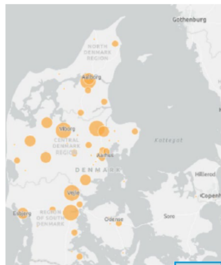
Figur 1: Geografisk fordeling af optometrist-studerendes praktikpladser i Danmark.