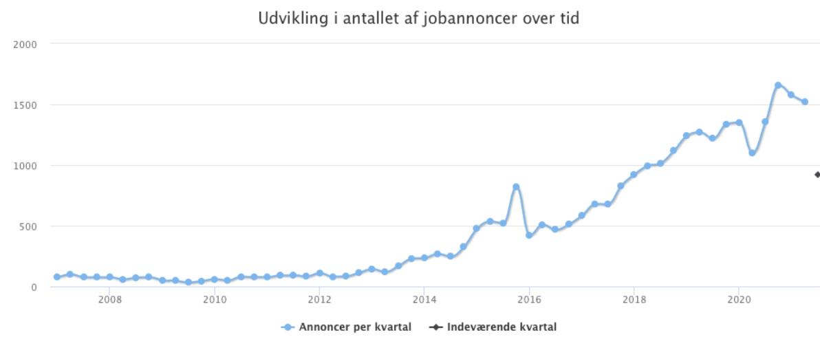
Figur 1 Jobannoncer per kvartal indeholdende ordene 'dataanalyse', 'big data', 'machine learning', 'data steward', 'data science', 'data scientist', 'datavidenskab', AI, 'artificial intelligence' og 'kunstig intelligens'

Behovene i rapporterne ovenfor er naturligvis baseret på analyser og antagelsesbaserede fremskrivninger, men understøttes i høj grad af den faktiske efterspørgsel på arbejdsmarkedet. I Figur 1 nedenfor vises udviklingen i antal udbudte stillinger inden for dataanalyse og AI.