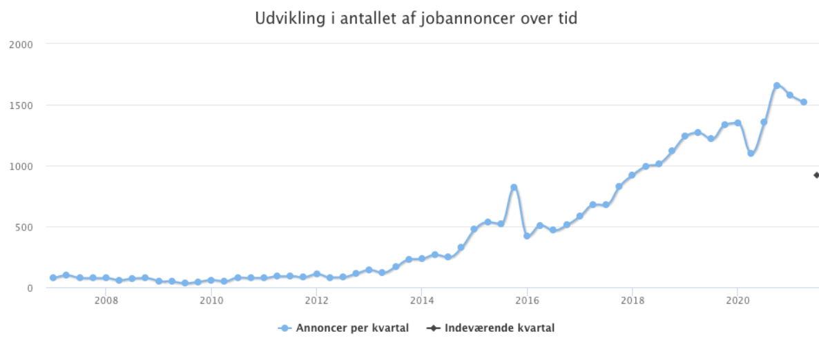
Figur 1 Jobannoncer per kvartal indeholdende ordene 'dataanalyse', 'big data', 'machine learning', 'data steward', 'data science', 'data scientist', 'datavidenskab', AI, 'artificial intelligence' og 'kunstig intelligens'

Behovene i rapporterne ovenfor er naturligvis baseret på analyser og antagelsesbaserede fremskrivninger, men understøttes i høj grad af den faktiske efterspørgsel på arbejdsmarkedet. I Figur 1 nedenfor vises udviklingen i antal udbudte stillinger inden for dataanalyse og AI.