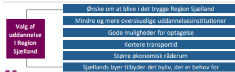
Figur 1 Region Sjællands Uddannelsesanalyse 2021, s54

Kilde: Kvalitative interviews med 9 unge, der uddanner sig i Region Sjælland