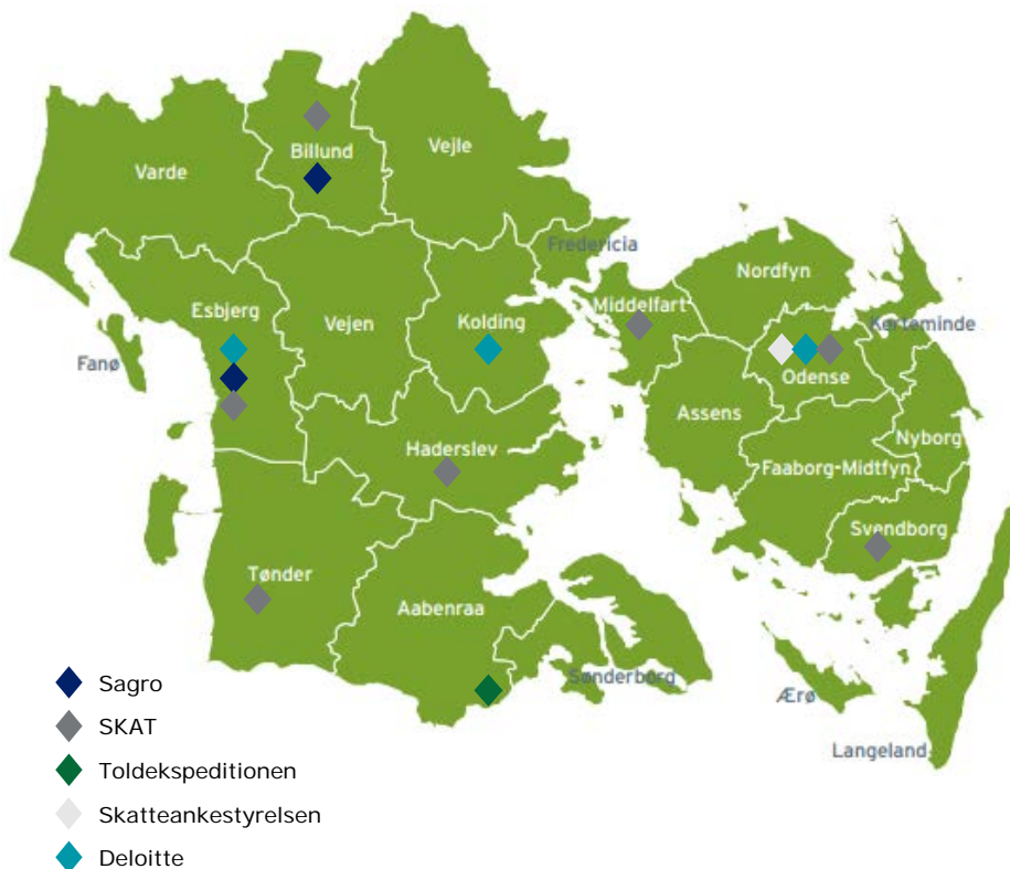
Figur 1: Interviewpersonernes arbejdssteder i Region Syddanmark pr. 1. august 2018