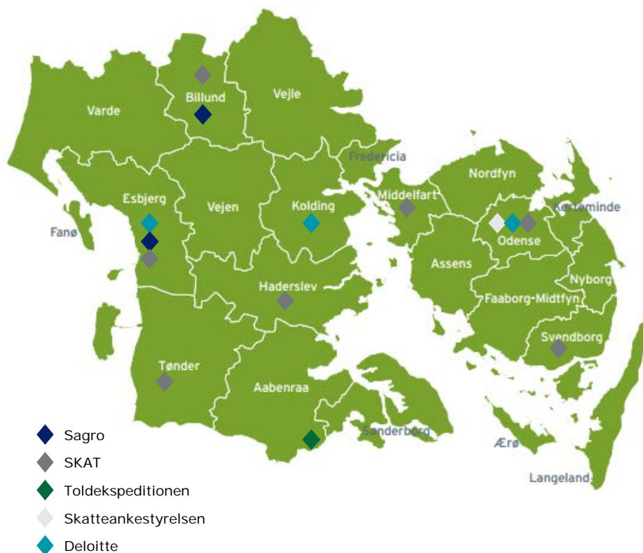
Figur 1: Interviewpersonernes arbejdssteder i Region Syddanmark pr. 1. august 2018