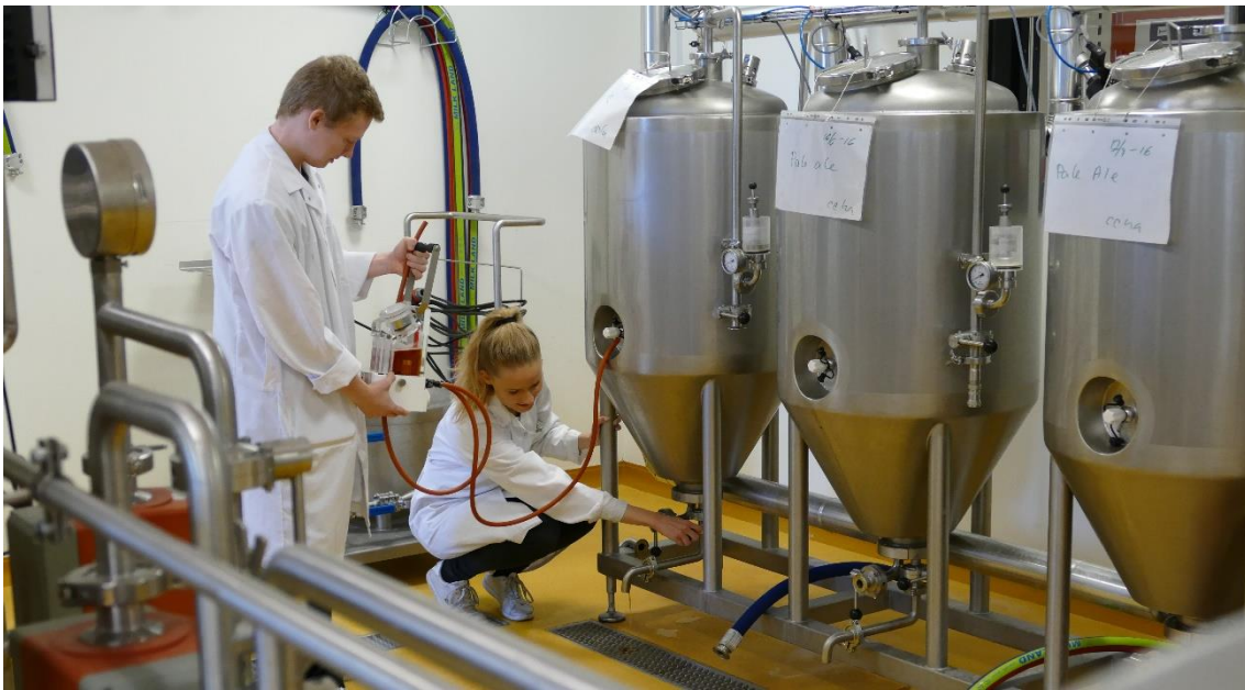
BILLEDE 1: Produktionsanlæg hvor studerende produktudvikler og undersøger forskellige faktoreres indflydelse på produktet samtidig med at kvaliteten hele tiden sikres.