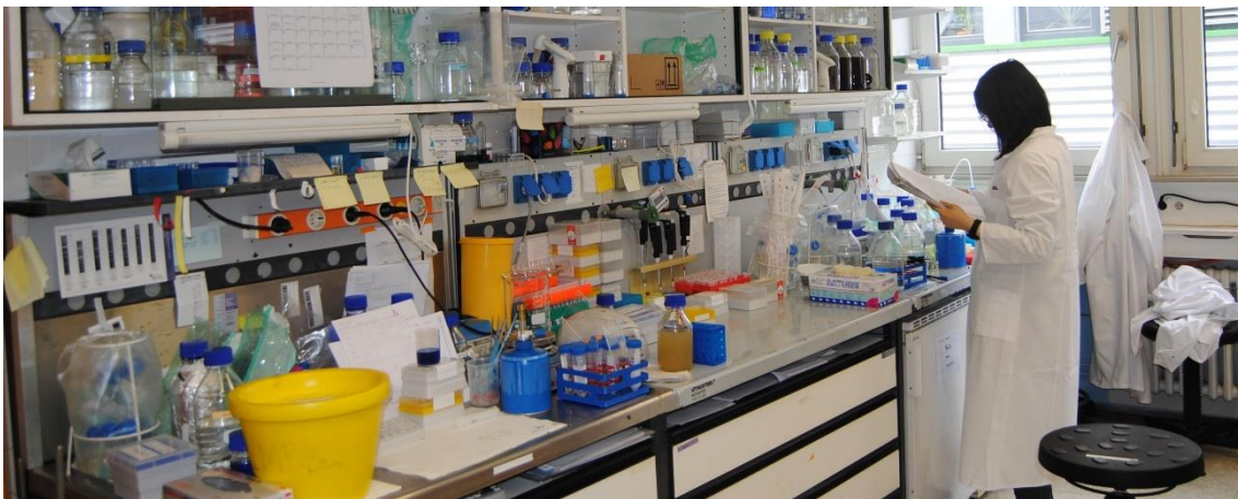
BILLEDE 2: Mikrobiologisk kvalitetssikring.

Fødevarsikkerhed både mikrobiologisk, kemisk og fysisk er absolut essentielt i uddannelsen og allerede indtænkt. Det er nu også beskrevet tydeligere i uddannelsens beskrivelse.