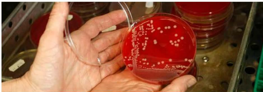
Figur 1 Mikrobiologisk kontrol og kvalitetssikring

Nogle har allerede job, før de dimitterer. De job, som dimittenderne besidder, er typisk inden for produktudvikling samt fødevarer sikkerhed og -kvalitet. Dimittenderne er bl.a. ansat i Chr. Hansen, Danpo, Danish Crown, SystemFrukt, Denico Food Ingrediens, Palsgaard.