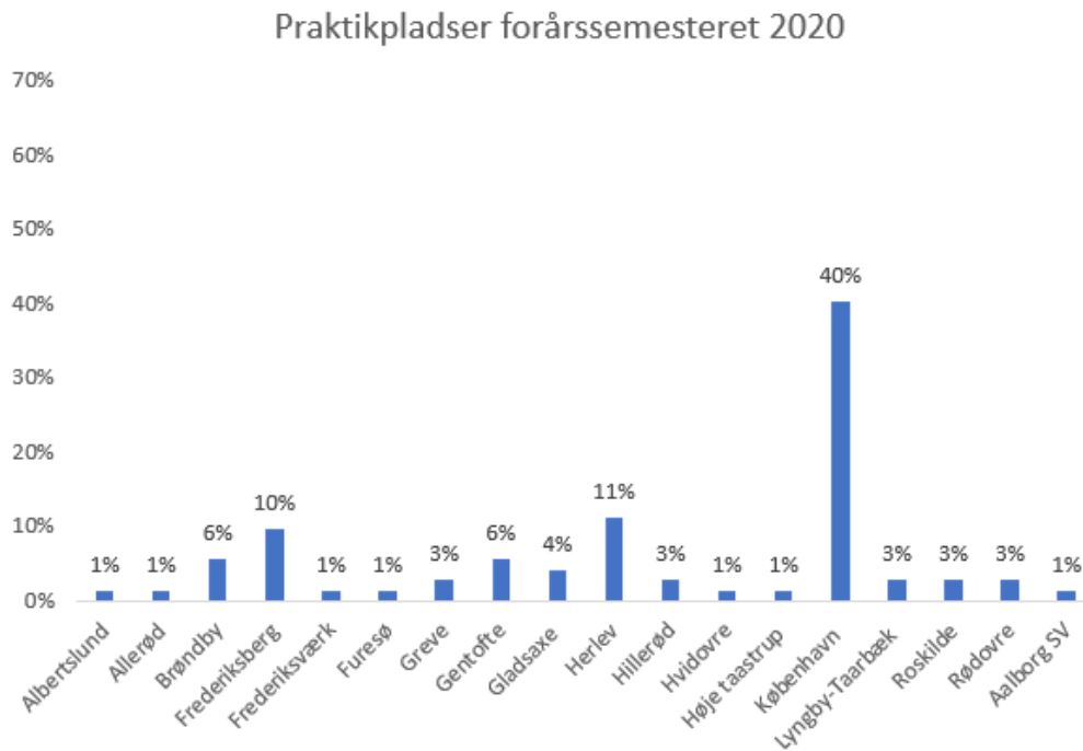
Figur 3. Beliggenhed af praktikvirksomheder 3