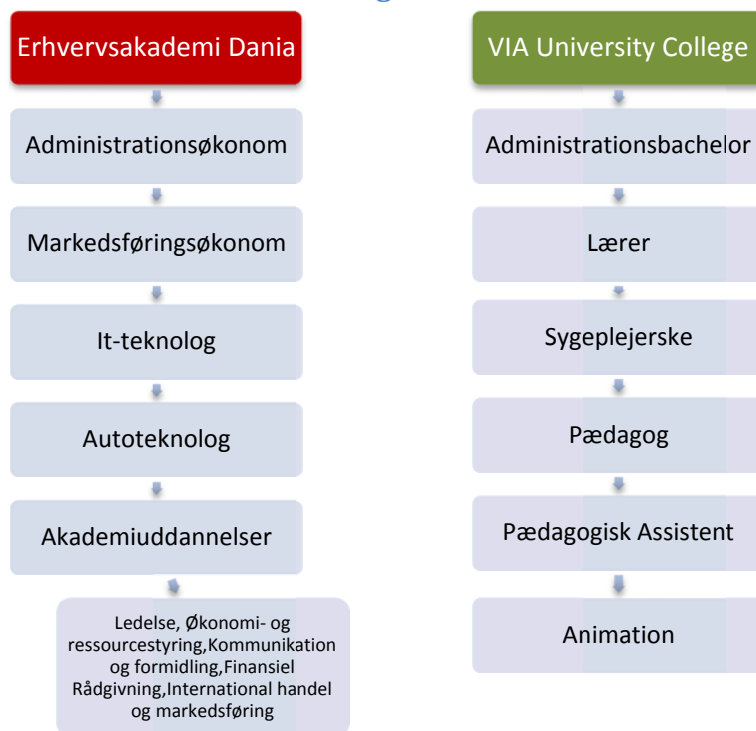
Figur 2 – Uddannelser ved EA Dania og VIA