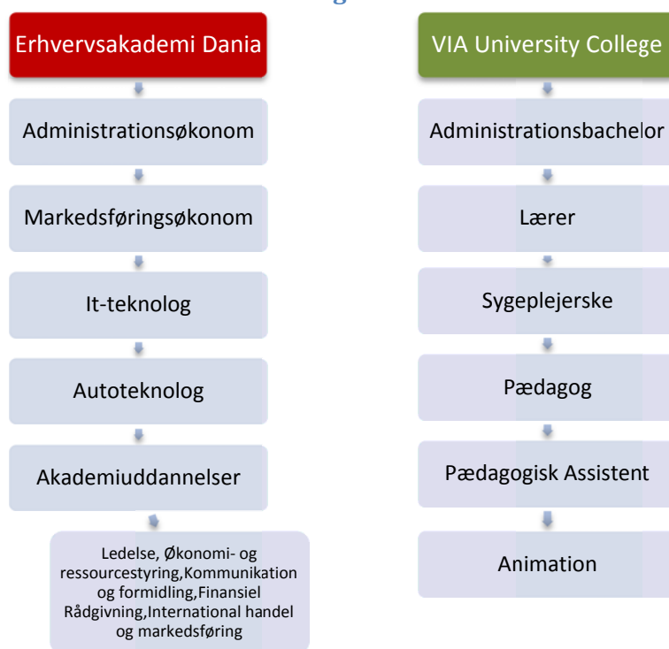
Figur 2 – Uddannelser ved EA Dania og VIA